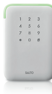
XS4 2.0 Wandler mit kapazitivem Tastenfeld